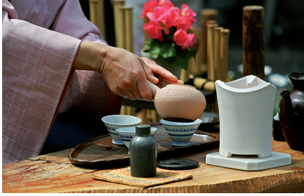
Коньяк, мед і китайські хитроці.

Жодна пора року не обходиться без легкої (якщо пощастить) застуди. Червоне горло, хриплий голос, вічний шарф навколо шиї і теплий чай, який вже починає викликати роздратування. Хочете позбутися всього цього та ще й хитрими способами? Від коньяку до редьки: ось кілька перевірених рецептів, які позбавлять вас від хворого горла раз і назавжди, інформує Ukr.Media.