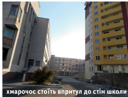
хмарочос стоїть впритул до стін школи

Святошинські «зелені» звернулися в районну прокуратуру з проханням перевірити законність будівництва за